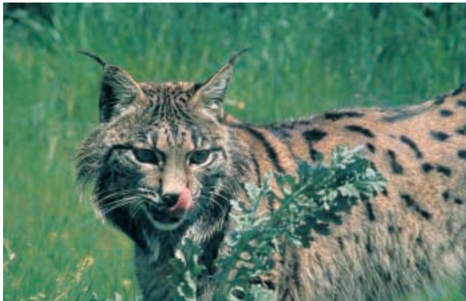
■ El lince ibérico es el felino más amenazado del mundo.

El Plan de Cría en Cautividad considera esencial manejar genéticamente a la población cautiva de lince ibérico con el fin de retener la máxima variabilidad y prevenir, en la medida de lo posible, la consanguinidad. De hecho, se pretende crear un Banco de Recursos Genéticos