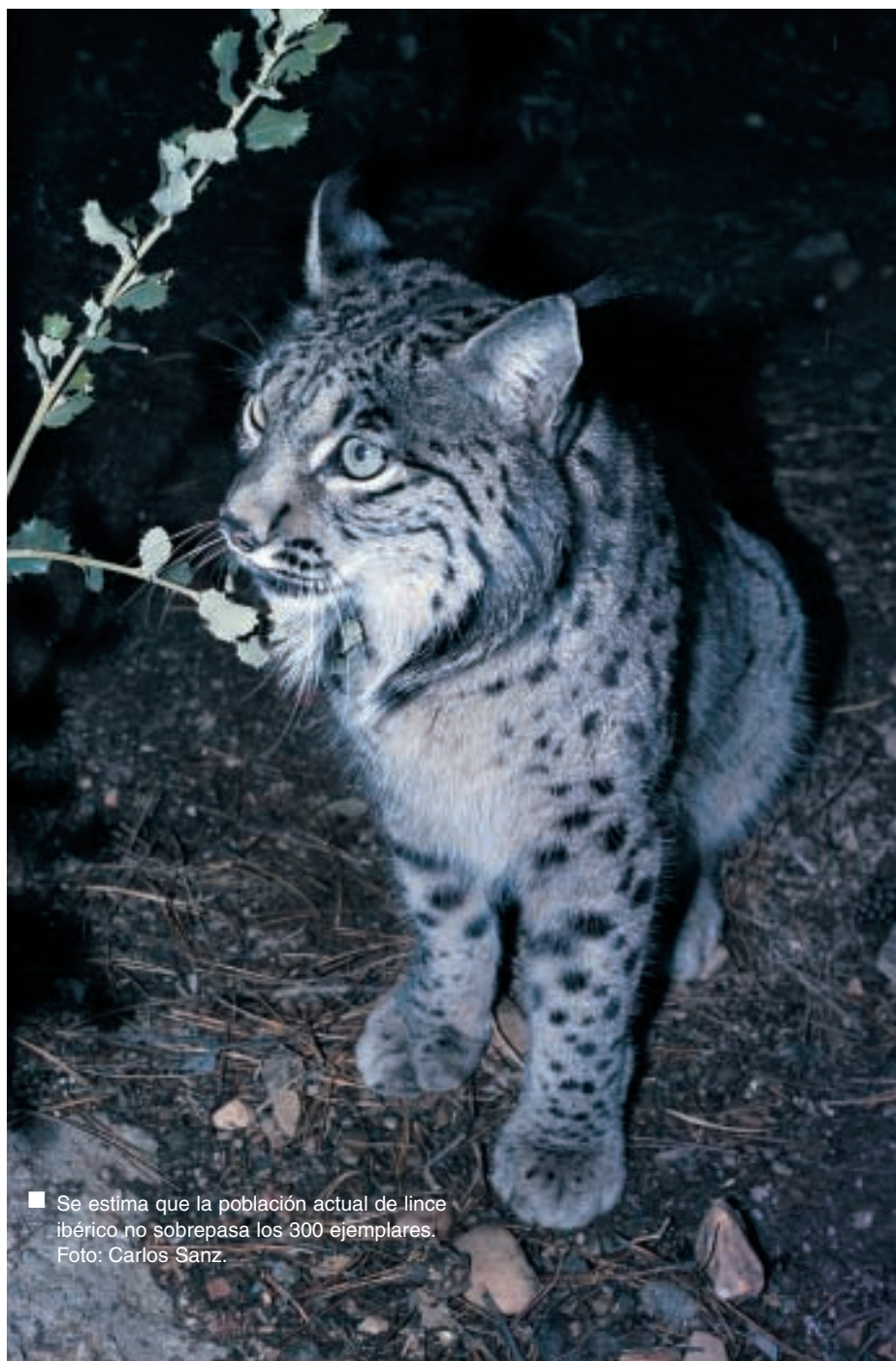
■ Se estima que la población actual de lince ibérico no sobrepasa los 300 ejemplares.