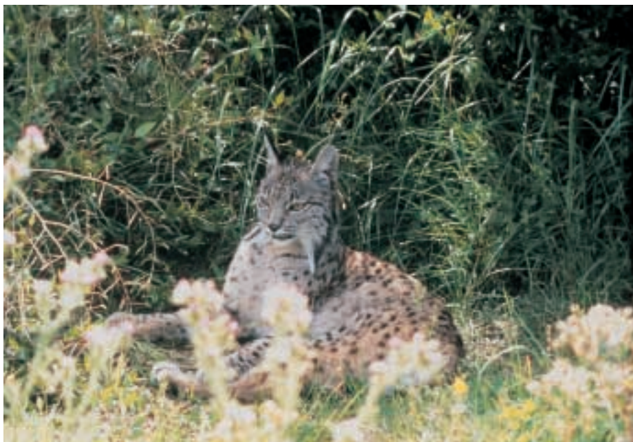
■ Uno de los objetivos del Plan es mantener la población cautiva en un estado sanitario óptimo.

Del mismo modo, el estado sanitario de una población cautiva es crítico para su bienestar, para su éxito reproductor y para su supervivencia a largo plazo, y los programas veterinarios para especies amenazadas mantenidas en cautiverio han de ser preventivos en vez de