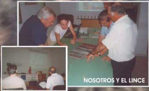
NOSOTROS Y EL LINCE

El objetivo último del proyecto es asegurar la viabilidad a largo plazo de las dos poblaciones principales de Lince ibérico en Andalucía y mantener y mejorar las posibilidades de conexión entre las distintas subpoblaciones. Para conseguir esto, se plantean una serie de objetivos más concretos entre los que destaca el de mejorar la percepción del papel que el Lince ibérico juega en el ecosistema.