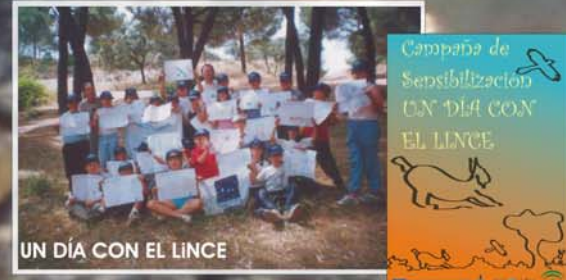
UN DÍA CON EL LINCE

Se propone una campaña de educación ambiental titulada: "Un día con el Lince" y que se llevará a cabo por los Centros educativos de zonas prioritarias de las provincias linceas (Córdoba, Huelva, Jaén y Sevilla).