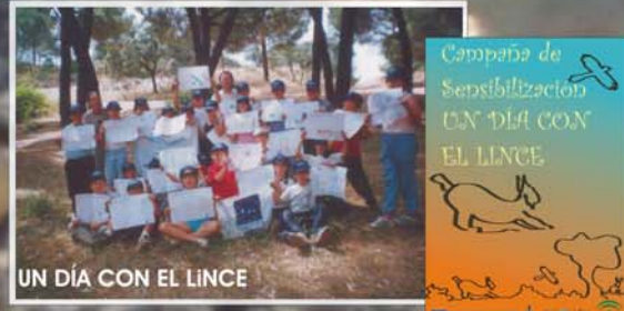
UN DÍA CON EL LINCE

Se propone una campaña de educación ambiental titulada: "Un día con el Lince" y que se llevará a cabo por los Centros educativos de zonas prioritarias de las provincias linceas (Córdoba, Huelva, Jaén y Sevilla).