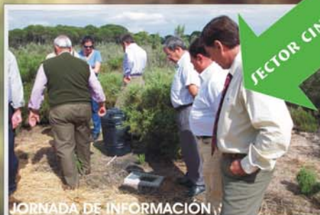
JORNADA DE INFORMACIÓN

Jornadas de información para una actividad cinegética responsable con organizaciones actualmente coincidiendo con el inicio de las aperturas de pedregal de caza.