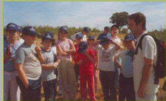
Indications sur le réseau Natura 2000, le linx pardelle et ses menaces Directions about Red Natura 2000, about the Iberian lynx and the threats affecting it.