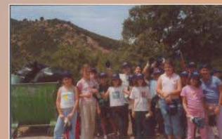
Quand se termine la collecte des débris After garbage picking, a group of schoolchildren