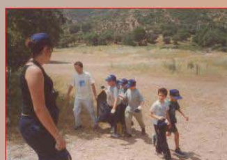
Collecte de débris dans une aire récréative Garbage picking on a playground