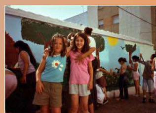
Peinture sur le mur de l'école Painting the walls of the School