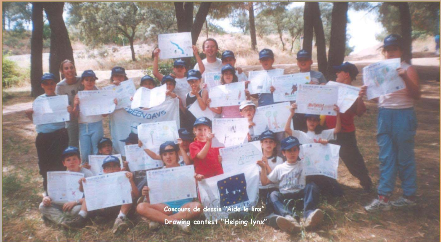
Concours de dessin "Aide le linx" Drawing contest "Helping lynx"

Getting people to know what is Red Natura 2000 and rising awareness between schoolchildren with respect to the threats affecting the Iberian lynx. Such activities are carried out in a fun way in which children can participate.