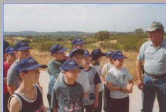
Le groupe de scolaires et le maître After garbage picking, a group of schoolchildren