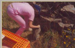
Libération de lapins Releasing of rabbits