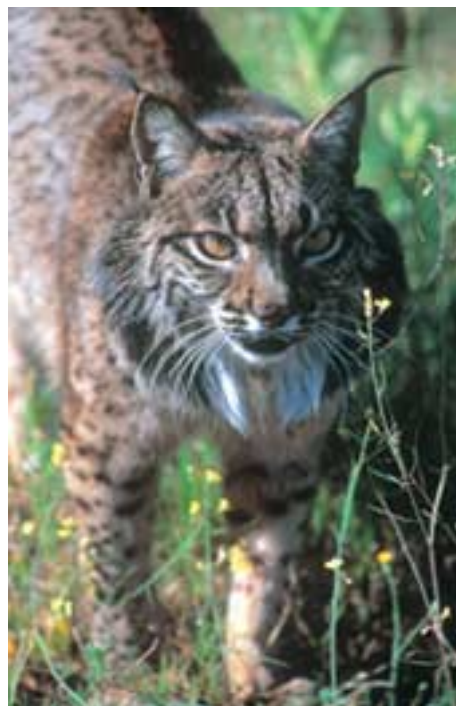
Lince ibérico ( Lynx pardinus )

En conclusión, además de favorecer puntualmente a las poblaciones de Lince, se trata de hacer ver la compatibilidad entre usos y aprovechamiento de las fincas incluidas en la futura Red Natura 2000 y su conservación.