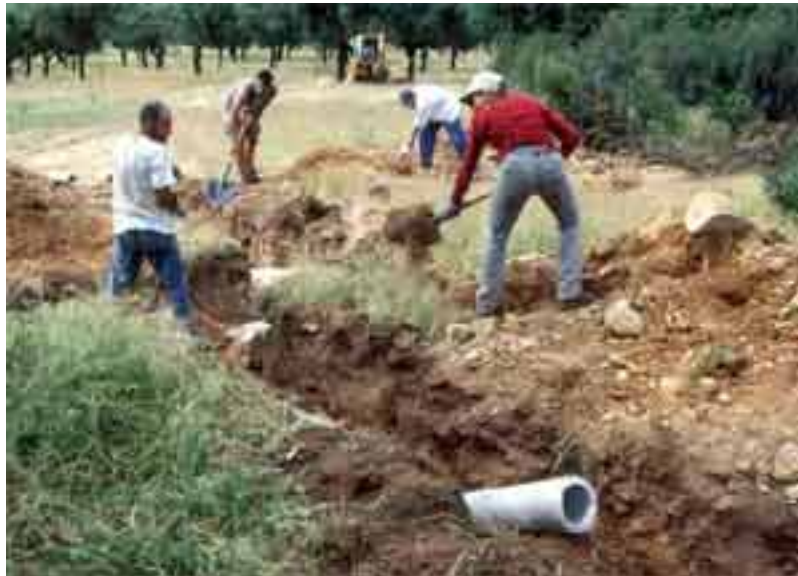
construcción de vivares subterráneos