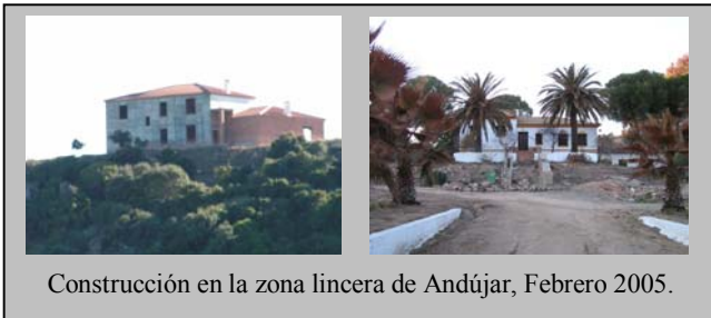
Construcción en la zona lincera de Andújar, Febrero 2005.

Desafortunadamente, el Ayuntamiento de Andújar continúa con su propuesta de reclasificar la zona conocida como “Viñas de Peñallana” como Suelo Urbano No Consolidado. En los últimos años se han construido ilegalmente numerosas casas. La propuesta del Ayuntamiento permitirá legalizar estas construcciones – sentando un peligroso precedente – y favorecerá las nuevas construcciones en el futuro.