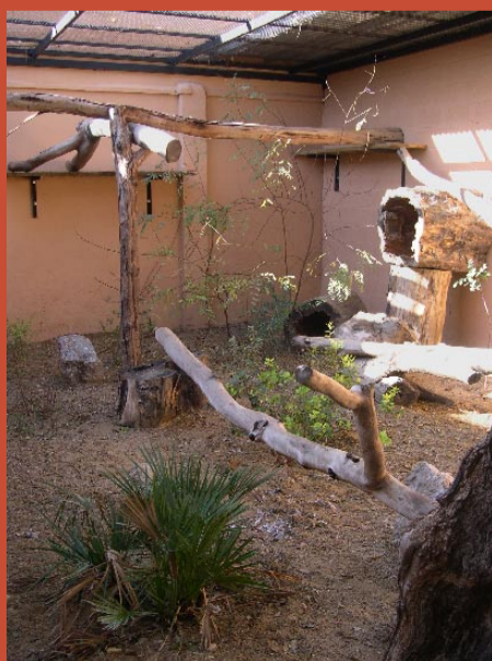
Instalación para cachorros en el Zoo de Jerez

Cada instalación ha de contar con un espacio mínimo de 1.200m 2 , aunque es preferible que cada instalación pueda ampliarse hasta unos 2.500 m 2 , constituyendo así un cercado de preselta que simule el entorno natural del lince y sirva para la preparación de cachorros destinados a programas de reintroducción. El personal míni-