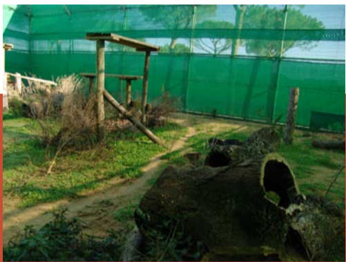
"Voladero" del CREA El Acebuche, P. N. Doñana.

Brezo fue separado definitivamente de la camada el pasado 28 de octubre, a los siete meses de vida, coincidiendo con la época en que tiene lugar la dispersión temprana de los lince en la naturaleza. Brisa también será separada de su madre en breve, dejando a Saliega sola antes de que dé comienzo la temporada de cría del 2006.