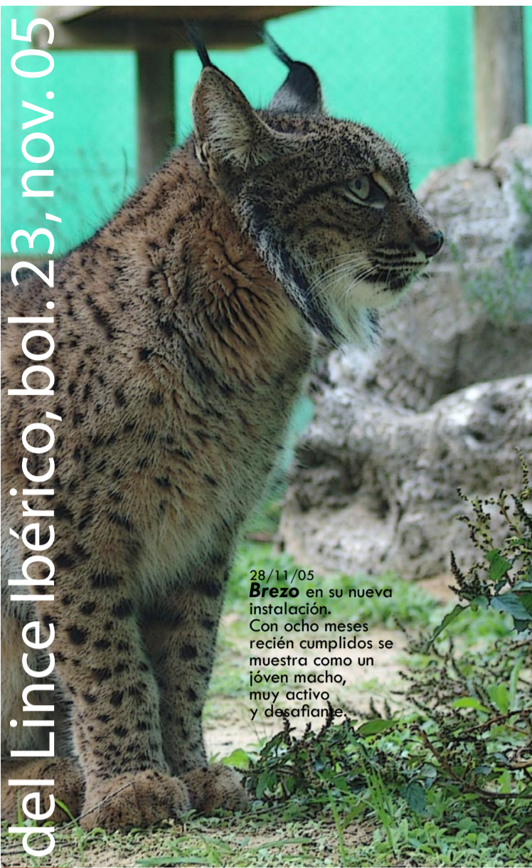
28/11/05 Brezo en su nueva instalación. Con ocho meses recién cumplidos se muestra como un joven macho, muy activo y desafiante.

Brezo fue separado definitivamente de la camada el pasado 28 de octubre, a los siete meses de vida, coincidiendo con la época en que tiene lugar la dispersión temprana de los lince en la naturaleza. Brisa también será separada de su madre en breve, dejando a Saliega sola antes de que dé comienzo la temporada de cría del 2006.