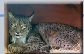
JUB , recién llegado al recinto de reproductores de El Acebuche

El pasado día 4 de octubre llegó a las instalaciones de El Acebuche un nuevo ejemplar de lince ibérico. Se trata de un macho de unos cuatro años de edad, conocido como Jacinto Ulises Bustamante (JUB) , recogido en Sierra Morena en marzo del 2003 debido a las numerosas heridas y traumatismos que presentaba. Desde su ingreso el 17 de marzo del 2003 en el Centro de recuperación de Especies Amenazadas (CREA) de Los Villares , en Córdoba, JUB ha sido objeto de un continuo seguimiento sanitario. Al igual que ocurrió con Garfio , la presencia de Cytauxzoon en JUB , ha dado lugar a numerosos análisis y consultas para valorar la conveniencia de su incorporación como