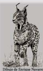
Dibujo de Enrique Navarro

Es importante destacar que los esfuerzos ex-situ están integrados dentro de la conservación in-situ y ayudan, por tanto, a resaltar la necesidad de aumentar las medidas de protección y mejora de hábitat para el lince. Poco sentido tendría comenzar a producir ejemplares en cautividad si este esfuerzo no va acompañado de un compromiso firme que asegure la conservación del hábitat suficiente para restablecer al lince en sus áreas de distribución histórica.