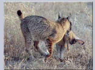
Morena con su presa.