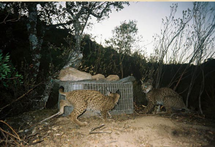
cachorros nacidos en 2005 en la Sierra de Cardena

En este nuevo número de El Gato Clavo se presentan los resultados de la reproducción de la última temporada de cría, al tiempo que se ofrecen los datos desde el año 2001, cuando se puso en marcha el Programa de Actuaciones para la Conservación del Lince ibérico en Andalucía y, a partir de 2002, el Proyecto Life "Recuperación de las poblaciones de lince ibérico en Andalucía".