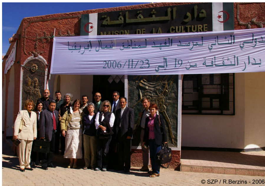
Participants à la 2 e réunion de l'OGRAN devant la Maison de la Culture de Tamanrasset

L'organisation de la réunion de l'OGRAN sur place a été assurée par la Conservation des Forêts de Tamanrasset. La DGF et l'OPNA ont conjointement mis à disposition leurs véhicules tout-terrain pour les besoins de la sortie.