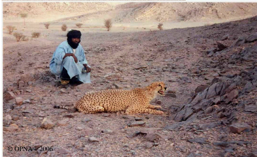
Femelle capturée et relâchée le 15/07/06 dans la région naturelle de l' Eggeré. En arrière plan, un agent de la conservation de la cellule de l'OPNA chargé du suivi du guépard

Ainsi depuis 1996, 31 signalisations ont été enregistrées (attaques, empreintes, observations directes) dont les plus récentes datent d'avril 2004 et de juillet 2006. Toutes les signalisations ont été dûment vérifiées et répertoriées, ce qui nous a permis de cerner l'espace géographique occupée par cette espèce (distribution géographique), et identifier son habitat. Toutefois, une observation assez surprenante et quasiment inexplicable a ce moment là, faite lors d'une mission de prospection dans la région de Talegh Teba en 1998; il s'agissait de reste de cadavre d'une gazelle dorcas fraîchement chassée et consommée, suspendu à un rameaux d'acacia!!!