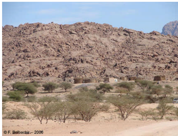
Campement humain dans la localité de Taghlalt (Ahaggar, Novembre 2006)

L'entrée dans la localité de Taghlalt a été marquée par la présence d'un petit campement humain. Un peu plus loin, les véhicules ont marqué un arrêt et la mission a réalisé une courte investigation pédestre, passant par une série de petits points d'eau ou gueltas . En cours de trajet, la mission a observé une Buse ( Buteo cf. rufinus ) en vol, une Couleuvre de Schokar ( Psammophis schokari ) blessée, dissimulée entre des rochers, et des empreintes laissées vraisemblablement par un chien.