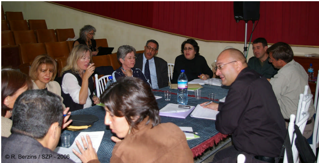
Participants réunis autour d'une table ronde favorable aux échanges sur les thèmes abordés lors des ateliers