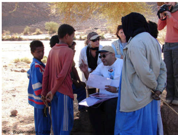
Séance de reconnaissance de la faune locale avec des enfants du village de Tagmart (Ahaggar, Novembre 2006)

Après avoir quitté le camp de nuit, la mission s'est arrêtée au village de Tagmart où une discussion sur la faune locale a été engagée avec des enfants. La présence de troupeaux de chèvres a été particulièrement notée. Un remarquable spécimen d' Acacia tortilis raddiana a été soigneusement inspecté pour d'éventuel indices de présence du guépard, mais sans résultat.