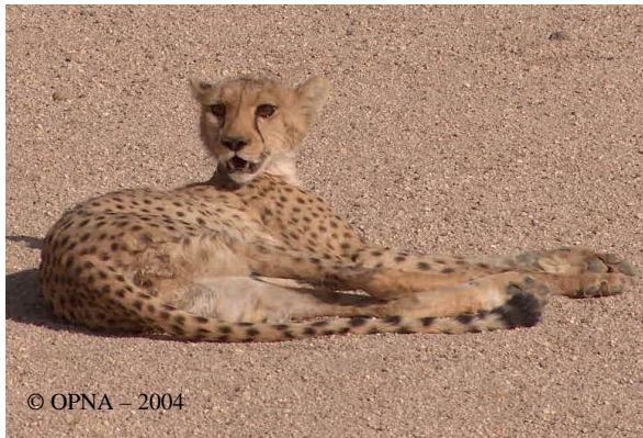
Femelle capturé puis relâchée en avril 2004 dans la région naturelle de la Tafedest

guépards dont elle s'est retirée pour chasser (fait rapporté par le chamelier). La dernière capture remonte à juillet 2006 dans la région naturelle de l' Eggeré.