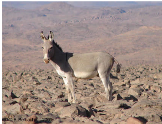
Ane sauvage ( Equus asinus africanus ) photographié dans un biotope rocheux et rocailleux dans la localité de Mejjeroûrene (Ahaggar, Novembre 2006)

L'arrivée au village de Terhenânet, situé à une distance d'environ 70 kilomètres de Tamanrasset, a été précédée par une autre rencontre de six ânes sauvages évoluant dans un biotope rocailleux et, plus loin, l'observation d'un remarquable spécimen de Faidherbia albida (Fabaceae/Mimosoideae) en fructification. Un paysage à Acacia ehrenbergiana et quelques palmiers-dattiers, avec au loin le Pic d'Illamane a particulièrement été apprécié.