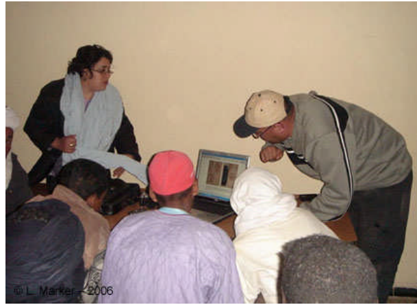
Séance d'apprentissage à la reconnaissance des empreintes de guépard dans une école du village de Terhenânet (Ahaggar, Novembre 2006)

Un camp de nuit a été établi dans une vallée non éloignée du village de Terhenânet et un Crapaud vert ( Bufo viridis ) a été observé.