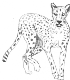
Guépard du Sahara

Le pelage du guépard du Sahara est moins contrasté que celui du guépard de l'Est africain. Sa tête paraît proportionnellement plus grosse et ses oreilles plus longues.