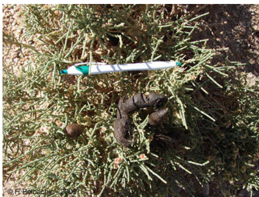
Laissée de carnivore contenant des poils déposée sur une touffe basse de Chenopodiaceae à Tagmart (Ahaggar, Novembre 2006)

Par ailleurs, une vipère à cornes ( Cerastes cerastes ) a été observée dans un site caillouteux et un cadavre de couleuvre étêtée, se rapportant vraisemblablement à une Couleuvre de Schokar ( cf. Psammophis schokari ), a été récupéré.