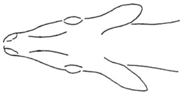
Фиг. В: Кожата одвнатре (растегната)