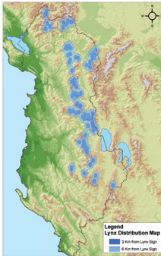
Harta e përhapjes së rrëqebullit në Shqipëri

Rrëqebulli nuk ka armiq natyrorë. Ai kërcënohet kryesisht me veprimtaria e njeriut. Rreziqet më kryesore janë: gjuetia e paligjshme, shkatërrimi i habitatit të tij, pakësimi i gjahut (kaproll, dhi e egër), popullata e vogël, si dhe kapaciteti i vogël riprodhues. Pakkush ka dëgjuar të flitet për rrëqebullin. Ai endet madhështor në malet e Shqipërisë, i rrethuar nga mistere e legjenda. Por tashmë ai rrezikon të zhduket dhe mbijetesa e tij varet nga ne, njerëzit. Vullneti dhe ndërgjegjësimi i njerëzve janë faktorë kyçë për shpëtimin e tij. A do të jemi në gjendje ta ruajmë këtë pasuri të natyrës sonë apo, me mospërfilljen tonë, do ta lëmë të zhduket?