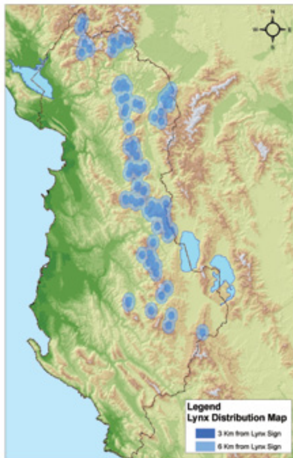
Harta e përhapjes së rrëqebullit në Shqipëri

Rrëqebulli nuk ka armiq natyrorë. Ai kërcënohet kryesisht me veprimtaria e njeriut. Rreziqet më kryesore janë: gjuetia e paligjshme, shkatërrimi i habitatit të tij, pakësimi i gjahut (kaproll, dhi e egër), popullata e vogël, si dhe kapaciteti i vogël riprodhues. Pakkush ka dëgjuar të flitet për rrëqebullin. Ai endet madhështor në malet e Shqipërisë, i rrethuar nga mistere e legjenda. Por tashmë ai rrezikon të zhduket dhe mbijetesa e tij varet nga ne, njerëzit. Vullneti dhe ndërgjegjësimi i njerëzve janë faktorë kyçë për shpëtimin e tij. A do të jemi në gjendje ta ruajmë këtë pasuri të natyrës sonë apo, me mospërfilljen tonë, do ta lëmë të zhduket?